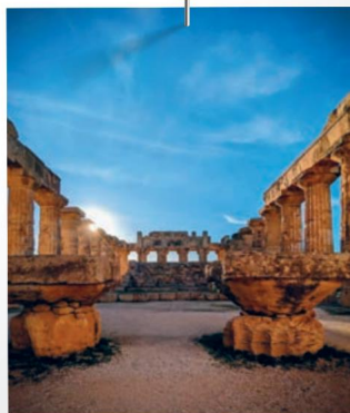
Sicilia 2023/2024 Classi Primo Biennio Percorso archeologico e nei luoghi simbolo della legalità