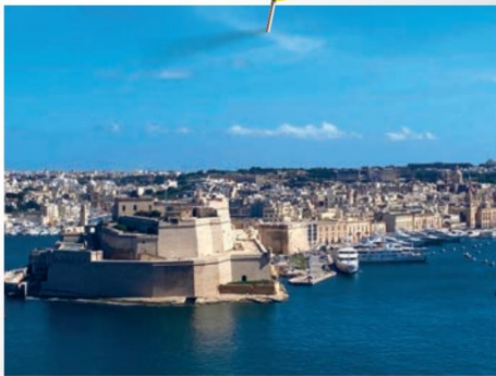
Malta 2023/2024 Classi Secondo Biennio Percorsi linguistici e di PCTO

Ma soprattutto esperienze emotive e sensoriali in cui gli studenti scoprono, si incuriosiscono ma non smettono mai di emozionarsi.